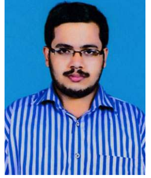
ସମ୍ପୂର୍ଣ୍ଣ ସତ୍ୟପ୍ରକାଶ ମିଶ୍ର