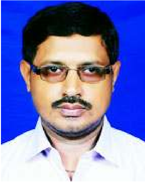
ଅନାମ ଚରଣ ପ୍ରାଦୁ