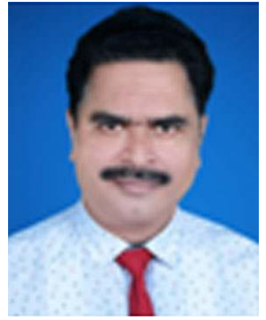
ଇଂ ବିଦ୍ୟାଧର ପଣ୍ଡା