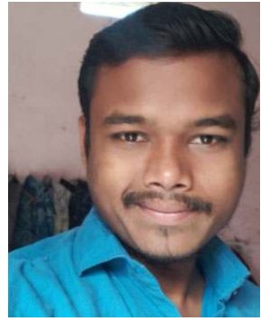
ସୁଭାସ ଚନ୍ଦ୍ର ଭୁଏ