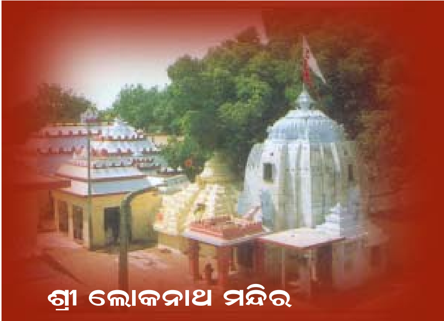
ଶ୍ରୀ ଲୋକନାଥ ମନ୍ଦିର