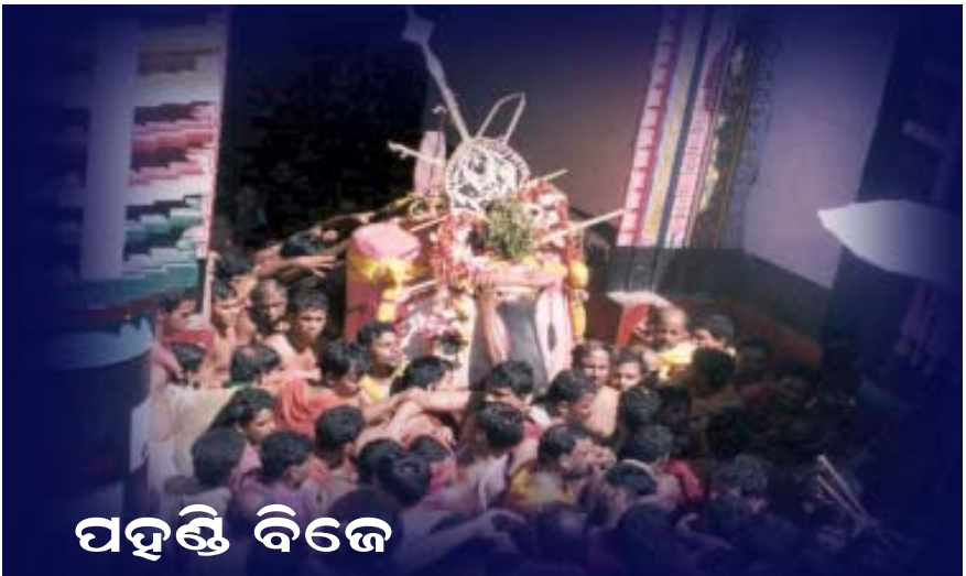
ପହଣ୍ଡି ବିଜେ ଆହ୍ଵାନ

୯ ମୁଦୁଲି: ଜୟବିଜୟ ଦ୍ଵାରର ଜଗୁଆଳି ଓ ଭଣ୍ଡାର ଜଗୁଆଳି ୧୦ ମହାଜନ: ପାର୍ଶ୍ଵ ଦେବତାଙ୍କୁ ନେବା ଆଣିବା କରିବା ୧୧ ମୁଖ ସିଂହାର ଦଉ: ତିନି ଦିଅଁଙ୍କର ମୁଖଚିତ୍ର କରିବା ୧୨ ଭଣ୍ଡାର ମେକାପ: ଦେବତାଙ୍କ ପୋଷାକ, ଅଳଙ୍କାର ଓ ଭଣ୍ଡାର ଘର ଜଗିବା କାର୍ଯ୍ୟ ୧୩ ଚାଙ୍ଗଡା ମେକାପ: ଦେବତାଙ୍କ ପୋଷାକ ଓ ଅଳଙ୍କାରମାନ ପିନ୍ଧାଇବା ଓ ତାଲାରେ ସଜାଇବା ୧୪ ଖୁଣ୍ଟିଆ: ପଶୁପାଳକ ମାନଙ୍କୁ ଡାକିବା ଓ