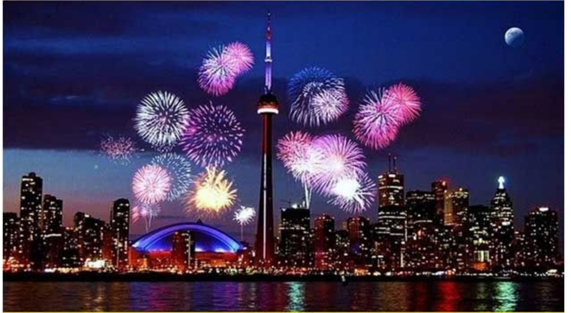
ମୋ ଭ୍ରମଣ କାହାଣୀ : ଟରୋଣ୍ଟୋ - ୭ ( ପୂର୍ବ ପ୍ରକାଶିତ ଉତ୍ତର ) ରଚନା : ଜାନୁୟାରୀ ୨୦୧୧