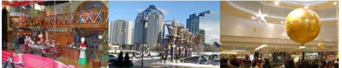
ନିନ୍ ଷ୍ଟାର୍‌ର ଏବଂ ସ୍ୱାର୍‌ବୋରେ ବଜାରରେ ଖ୍ରୀଷ୍ଟମାସ ତଥା ନୂଆବର୍ଷପାଇଁ ହୋଇଥିବା ମନୋରମ ସଜସଜ୍ଜା ର ଦୃଶ୍ୟ

ବରଷ ପାଇଁ । ଚାରିଆଡ଼େ ବରଫ ଆଉ ବରଫ । ଶଙ୍ଖ ଭଳି ଧଳା ଫରଫର ଓଡ଼ଣୀଟାକୁ ଧରଣୀ ରାଣୀ ପାରିଦେଇଥିଲା ଯେପରି ନୂଆବରଷ ପାଇଁ । ମୋର ସହଧର୍ମିଣୀ ଆଡ଼ର୍ଜାଲୀୟ ସେବା ମାଧ୍ୟମରେ ବିଦେଶୀ ପିଠା ପ୍ରସ୍ତୁତି ପ୍ରଣାଳୀ ଦେଖି ଗୋଟିଏ ସୁନ୍ଦର 'ଇଂରାଜୀ କେକ୍' ପ୍ରସ୍ତୁତ ମଧ୍ୟ କରିଥିଲେ ।