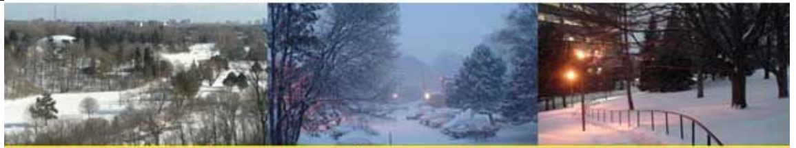
ଶ୍ରୀଲଙ୍କେରୁ ଭିଲେଇ, ଡନମିଲ୍ସ ରୋଡ ଏବଂ ବାର୍ଦ୍ଧା ଗ୍ରୀନ୍ ରୋଡର ସକଳ, ସନ୍ଧ୍ୟା ଓ ରାତ୍ରର ତୁଷାରପାତ ଦୃଶ୍ୟ