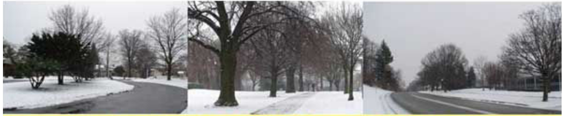
ମୋ ଘର ନକଟରେ ତୁଷାରପାତ ପରବର୍ତ୍ତୀ ନର୍ଥ ହିଲ୍ସ ଏବଂ ବାର୍ବର ଗ୍ରୀନ୍ ରୋଡ୍‌ର ଦୃଶ୍ୟ