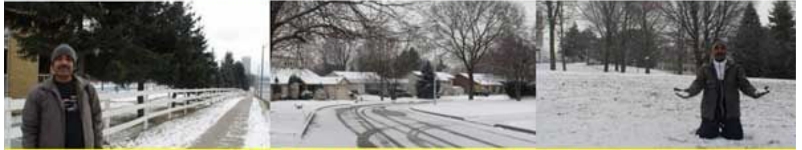
ମୋ ଗୃହ ପରିବେଶର ଧବଳମୟ ତୁଷାରଛନ୍ଦ୍ର ର ଦୃଶ୍ୟ