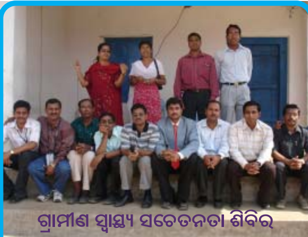
ଗ୍ରାମୀଣ ସ୍ୱାସ୍ଥ୍ୟ ସଚେତନତା ଶିବିର

ବ୍ୟାଞ୍ଜନ ଆମ୍ବୁଆ ମେଇନ୍ ରୋଡ୍, ବ୍ରହ୍ମପୁର, ୭୬୦୦୧୦, ଓଡ଼ିଶା ଫୋନ: ୯୨୩୮୬୮୫୬୯୮