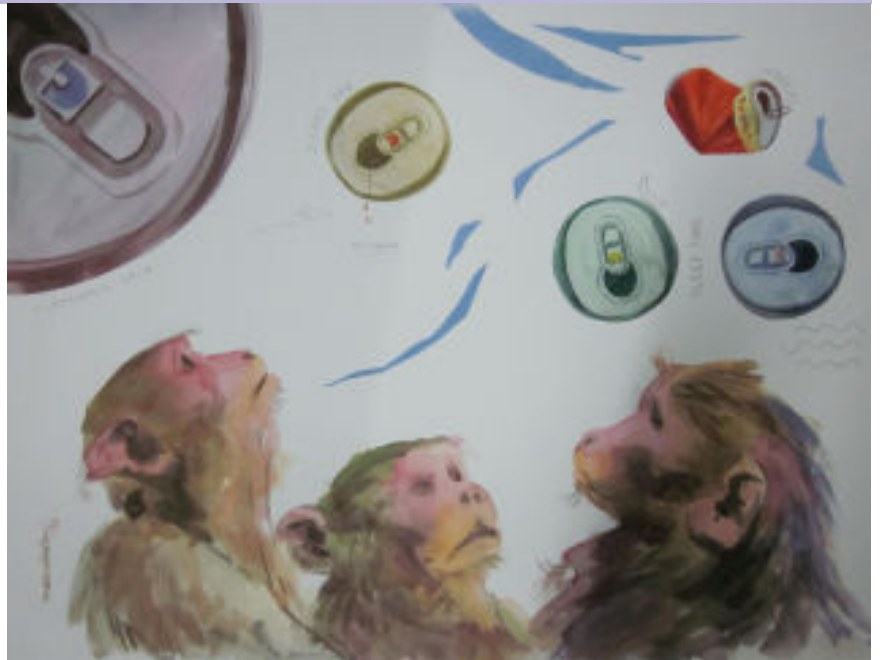
Monkey / drawing / water colour on paper / 2010 / at present available with the artist

ମୀନକେତନ ପଟ୍ଟନାୟକ ବି.କେ. ଆର୍ଟ କଲେଜ, ଖଣ୍ଡଗିରି ଭୁବନେଶ୍ୱର